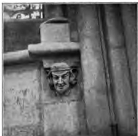
Sculpture de Notre-Dame.

Quelle que soit la richesse de la sculpture, elle ne doit d'ailleurs pas faire oublier les peintures murales et les verrières, encore que celles-ci se trouvent dans un fâcheux état. Des peintures, il ne reste que quatre fragments du XV e siècle, qui semblent appartenir à la manière flamande : à droite de l'entrée, la Vierge assise, en robe bleue et manteau rouge galonné d'or ; un peu plus loin, du même côté, sainte Sabine portant sa tête comme saint Denis ; du côté gauche, la Circoncision, le Baptême, et